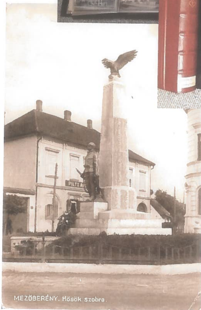
MEZŐBERÉNY. Hősök szobra.