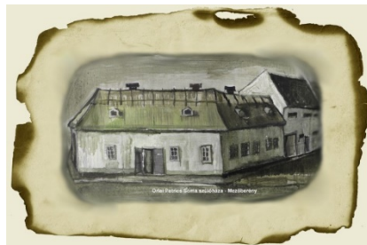
Petrich család háza

Helyén egykor a Petrich család háza állt, itt született a magyar történelmi és művelődéstörténeti festészet megteremtője Orlai Petrics Soma.