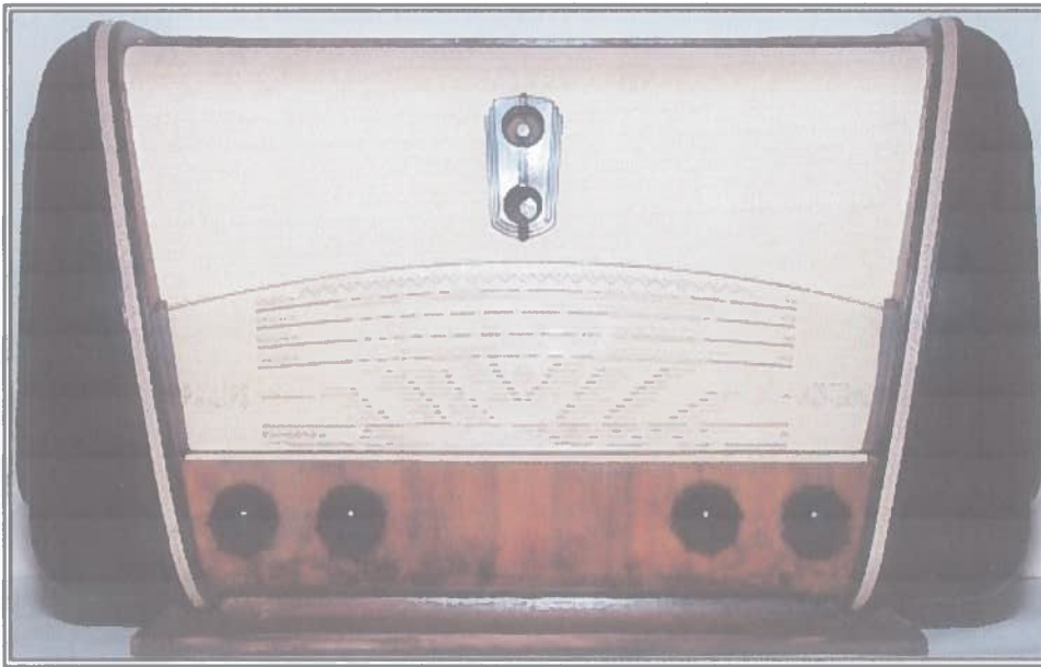
„Philips Mestermű 504 A”

települési értéktárba történő felvételéhez