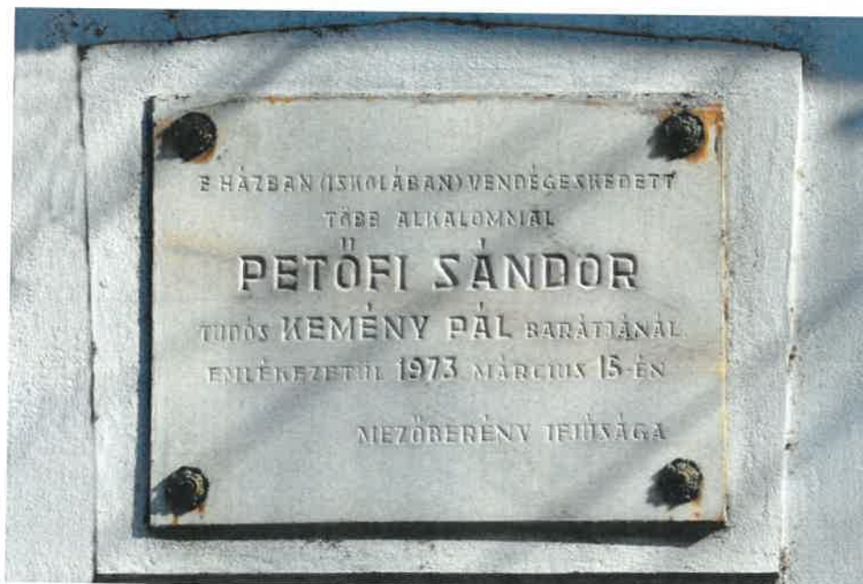
Emléktábla a Luther Márton tér 12-13. szám alatt