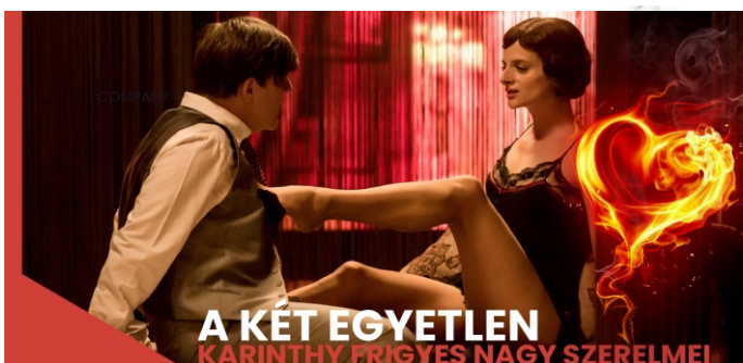
A KÉT EGYETLEN KARINTHY FRIGYES NAGY SZERELMEI