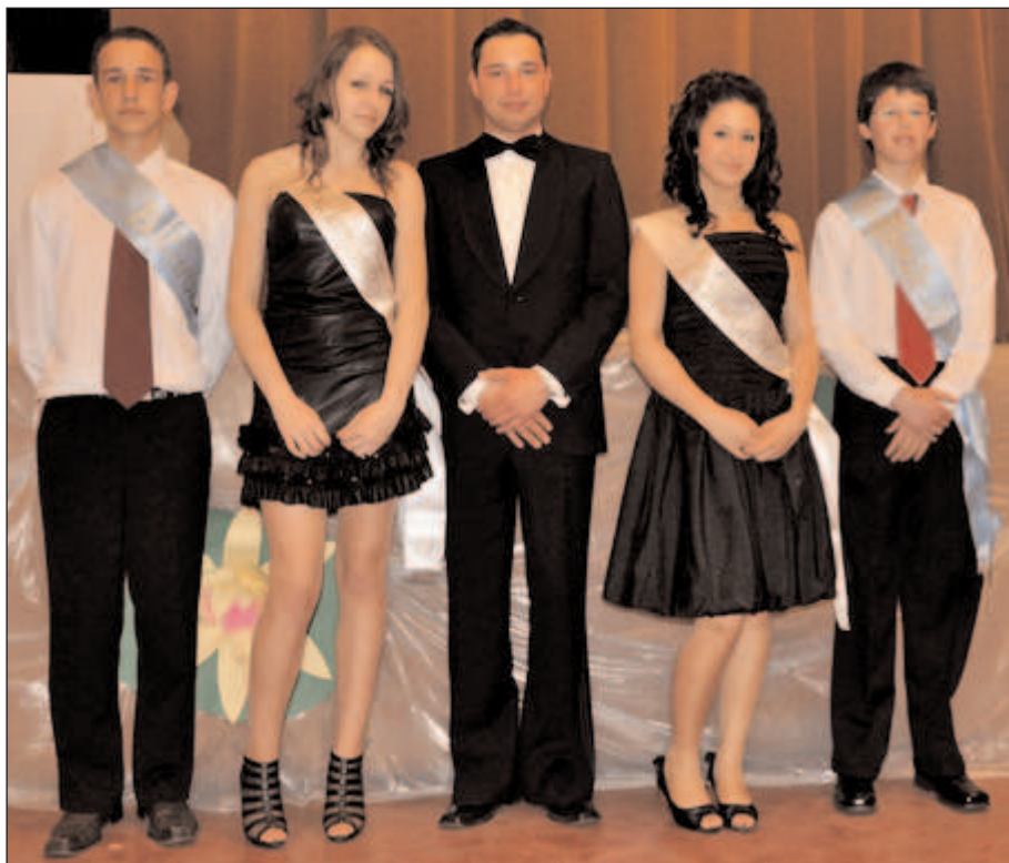
A képen láthatóak: