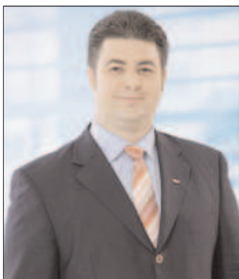
Erdős Norbert országgyűlési képviselő

- Először is engedj meg, hogy gratuláljak. A 3. számú választókerület országgyűlési képviselővé kaptál újból megbízást az itt élők-től, nem is kevés szavazattal. Mit gondolsz, mekkora felelősség ekkora bizalmat kapva dolgozni?