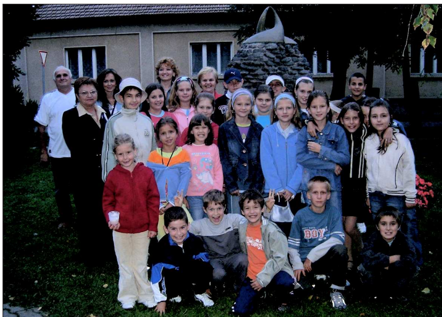
A felvételen: A kolárovi Nefelejcs néptáncsoport és a civil szervezet képviselői

A Mezőberényi Szlovákok Szervezete és az "Élet az éveknek" nyugdíjas közösségek első alkalommal rendezték meg 2005. szeptember 18-án a Dél-Alföldi Régió Amatőr Művészeti és Nemzetiségi Fesztiválját.