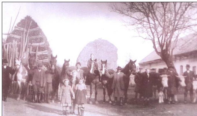
A felvétel Gútan, egy gazda udvarán készült 1940-ben.

(Az elhangzott beszéd szerkesztett, rövidített változata.)