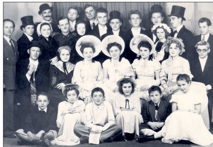
„Három a kislány” szereplőgárdája (mezőberényi KIOSZ ifjúság) 1957. 11. 14.