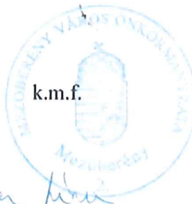
Buka Livia pénzügyi ügyintéző