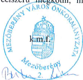
Buka Livia pénzügyi ügyintéző - könyvelő